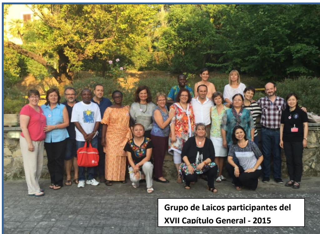
Grupo de Laicos participantes del XVII Capítulo General - 2015