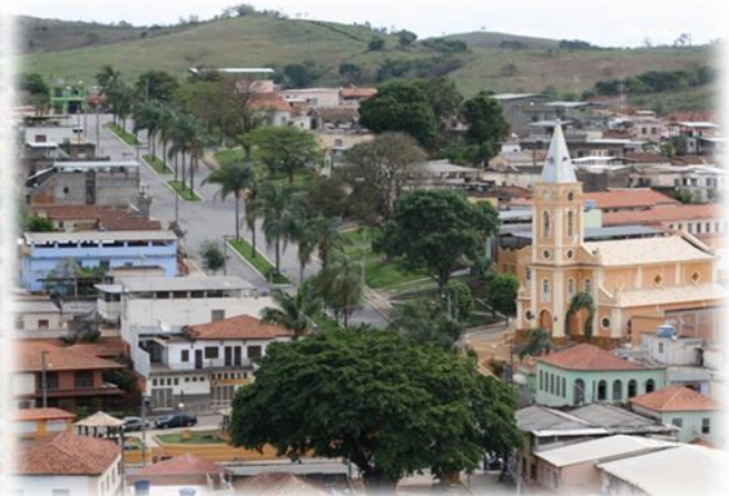
Campos Gerais, estado de Minas Gerais