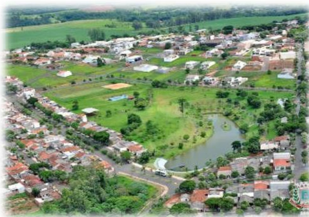
Mandaguaçu, estado do Paraná

Os retiros espirituais continuam na agenda de muitos grupos da Rede. Em janeiro, haverá um retiro em Mandaguaçu (Paraná), organizado para o grupo Santa Joana com a participação do grupo de Inajá (Paraná).