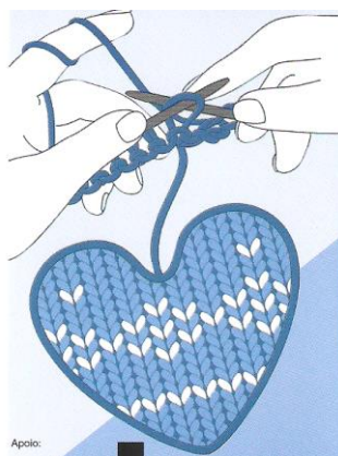
Símbolo do Grupo "Tecendo Alegria"