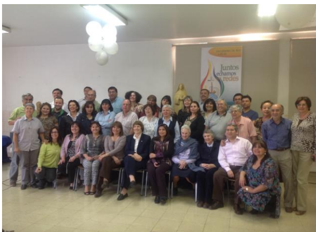
Encuentro en el Colegio de Apoquindo (26 de Octubre)

Allí nos encontraremos, con alegría, con los amigos y compañeros de la Red Cono Sur!