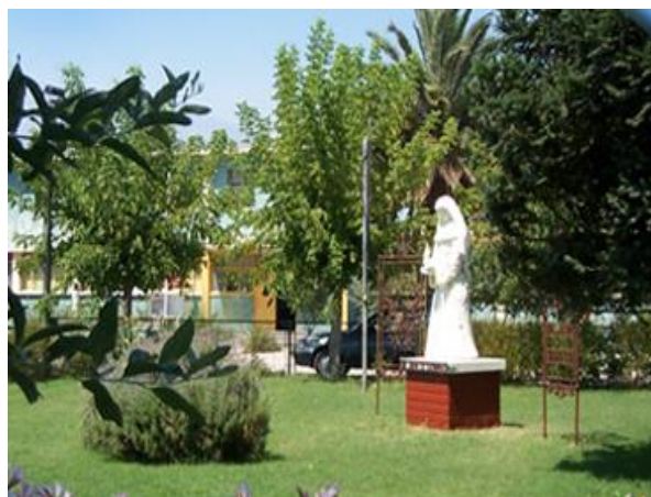
Encuentro en el Colegio de Puente Alto (30 de Noviembre)