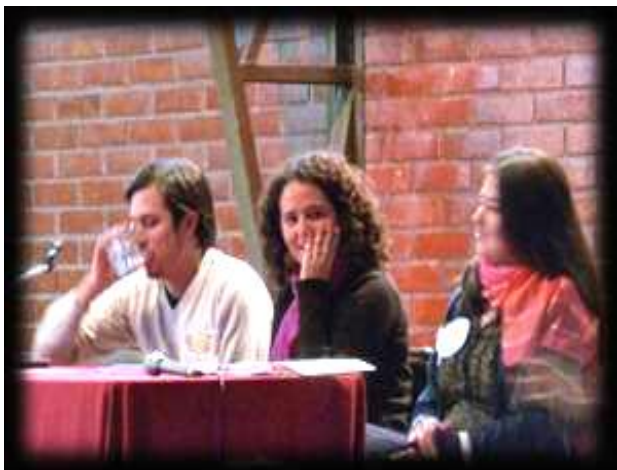
Encuentro de Laicos y religiosas, en el Colegio de Seminario (6 de Abril)

Esto es lo que hemos vivido durante este año como Red Laical Compañía de María, en Chile.