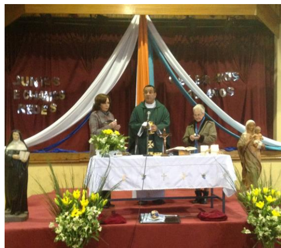
Celebración de la Eucaristía, en el Colegio de Seminario (24 de Agosto)

Así, como celebramos en el Encuentro de Laicos y religiosas, en el Colegio de Seminario, el 6 de Abril; hubo también una Celebración de la Eucaristía, en el Colegio Seminario el 24 de Agosto, y